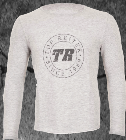
Askur herrabolur Stærðir XS-XXL Verð 7.990