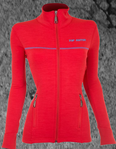
Sóley dömupeysa Stærðir XS-XL Verð 15.990 kr

er í fullum gangi hjá Top Reiter. Stórlækkað verð á vönduðum vörum.